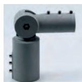
Adaptateur vertical AL60V

85V-277V 50-60Hz 120 Lm/watt >50000h LEDS Philips